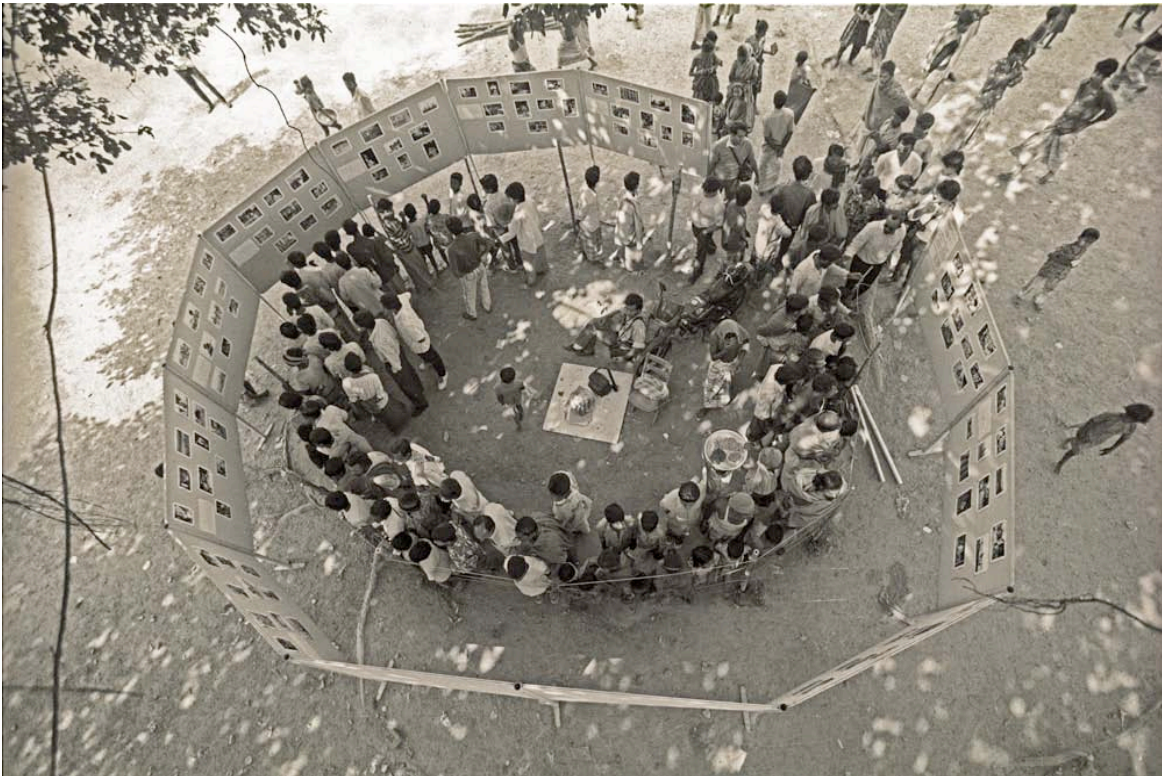
fotografía de la exhibición por Shahidul Alam © 1991